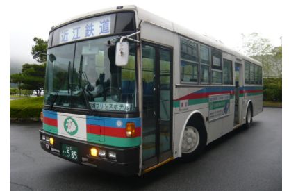
※近江鉄道バスが代理運行致します。